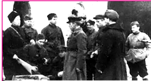
Партизаны-разведчики отряда «За власть Советов»

После операции по разгрому комендатуры в Суземке райком партии решил ликвидировать старост и полицейских в других сёлах района. Но в большинстве сёл старосты и полицейские сами покинули свои должности и