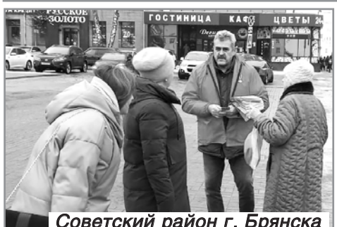
Советский район г. Брянска