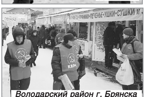
Володарский район г. Брянска