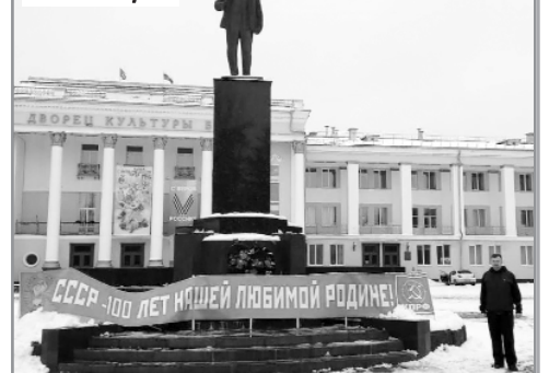
Советский район г. Брянска

том, что их волнует. И, конечно, вспоминали, как всё было раньше, когда страна называлась СССР, и все жили при социализме.