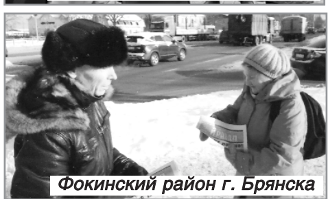
Фокинский район г. Брянска