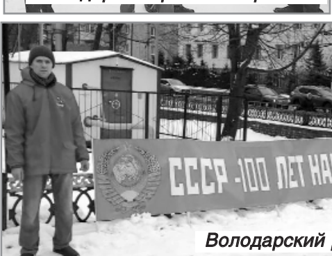
Володарский район г. Брянска