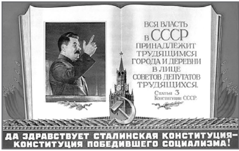
ДА ЗДРАВСТВУЕТ СТАЛИНСКАЯ КОНСТИТУЦИЯ — КОНСТИТУЦИЯ ПОБЕДИВШЕГО СОЦИАЛИЗМА!

5 декабря 1936 года VIII Чрезвычайный Съезд Советов принял новую Конституцию СССР, известную, как Сталинская. Именно с этой, самой демократичной и справедливой Конституцией для трудового народа, наша страна завершила индустриализацию, одержала победу в Великой Отечественной войне, восстановила народное хозяйство в послевоенные годы и открыла космическую эру.