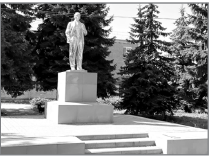
После обращения коммунистов в г. Фокино отремонтировали памятник В.И. Ленину.

В начале года коммунисты г. Фокино и комсомольцы обратили внимание на неудовлетворительное состояние памятника В.И. Ленину: наличие многочисленных механических повреждений на постаменте и фигуре памятника. В связи с этим депутат облдумы, секретарь обкома КПРФ К. Павлов направил обращение в прокуратуру. Проведённая по депутатскому запросу прокурорская проверка установила нарушения федерального закона «Об объектах культурного наследия (памятниках истории и культуры) народов Российской Федерации» при содержании муниципального имущества муниципальной г. Фокино, на чьём балансе находится этот памятник. Согласно этому закону прямая обязанность фокинских чиновников – своевременное проведение ремонтно-реставрационных работ.