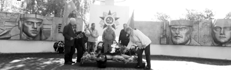
Коммунисты Злынки отметили 79-ю годовщину освобождения района от немецко-фашистских захватчиков.

После разгрома в Курской битве летом 1943 года немецкие войска стали довольно стремительно откатываться на запад, только время от времени цепляясь за ранее подготовленные оборонительные рубежи. Примерно также отступали на восток наши части летом-осенью 1941-го. Через Брянские леса отходила тогда и потрёпанная 137-я стрелковая дивизия. Теперь она вернулась в места тех неудачных кровопролитных боёв, приняв участие в освобождении городов и сёл Брянщины.