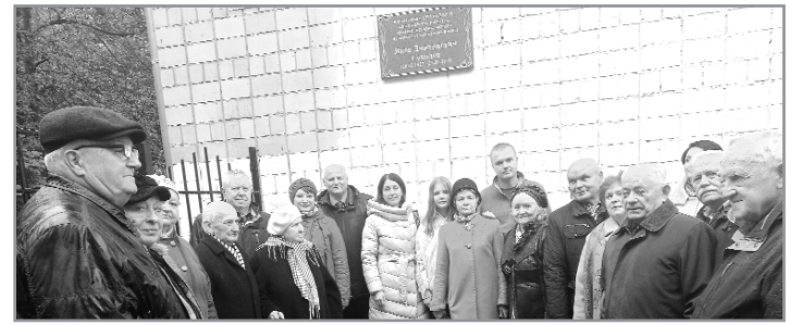
газеты «Брянский рабочий».