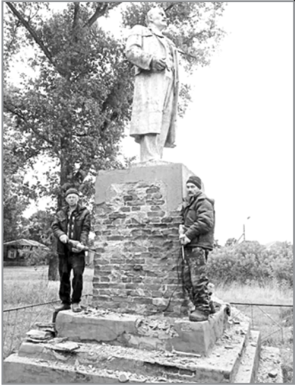
В Климовском районе откликнулись на просьбу коммунистов восстановить памятник В.И. Ленину.

Климовские коммунисты проводят большую работу по восстановлению обветшавших памятников и установке новых монументов, хранят и заботятся о сохранении истории родного края. Так, в самый разгар пандемии, летом 2020 года они