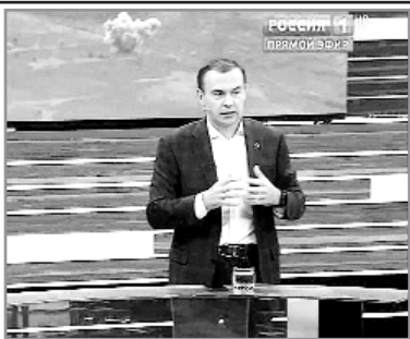
Первый заместитель Председателя ЦК КПРФ Ю. В. Афонин принял участие в программе «60 минут» на телеканале «Россия-1».

Первый зампред ЦК КПРФ прокомментировал крайне показательное высказывание советника главы офиса президента Украины Михаила Подоляка об ударах, которые ВСУ наносит по городам и гражданской инфраструктуре: «Нету никаких терактов и нету никакой гражданской инфраструктуры Российской Федерации на территории Украины. Мы освобождаем свою суверенную территорию. В рамках международного права мы вправе делать все, что считаем нужным».