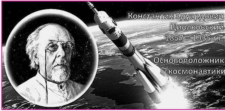
Константин Эдуардович Циолковский 1857 – 1935 г.г.

В 1873 году отец отправил Константина в Москву – поступать в Высшее техническое училище (ныне МГТУ им. Баумана). Юноша получил с собой письмо к приятелю отца, в котором Эдуард просил его помочь сыну обу-