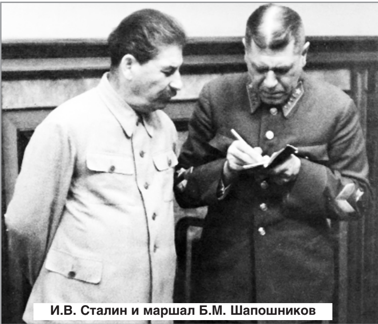
И.В. Сталин и маршал Б.М. Шапошников

происходило с И.В. Сталиным в Кремле и на Ближней даче. Якобы, когда находившемуся в Кремле Сталину доложили о начале войны, он долго не хотел верить, а затем уехал к себе на дачу. «Сталин выглядел старым, пришибленным, растерянным. Он длительное время фактически не руководил военными операциями и вообще не приступал к делам...»