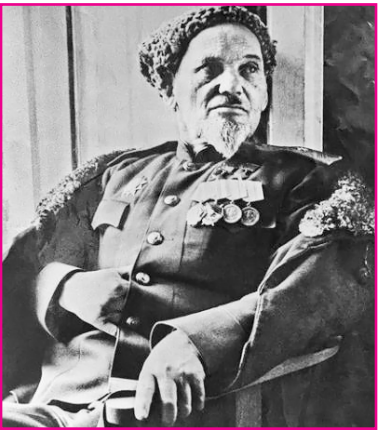
7 июня – 135 лет со дня рождения С.А. Ковпака, одного из организаторов партизанского движения в годы Великой Отечественной войны.

Сидор Артемьевич Ковпак родился 7 июня 1887 г. в украинском селе Котельва в крестьянской семье. У него было пять братьев и четыре сестры. С самого детства он помогал родителям по хозяйству: пахал, сеял, косил, ухаживал за скотиной. В церковно-приходской школе получил начальное образование. В 10 лет Сидор начал работать у местного торговца-лавочника, дослужившись к совершеннолетию до приказчика. Военную службу проходил в Александровском полку в Саратове. После окончания остался в этом городе, трудясь грузчиком в порту.