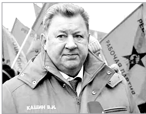
Доклад заместителя Председателя ЦК КПРФ, Председателя Комитета Госдумы по аграрным вопросам, академика РАН В.И. Кашина на парламентских слушаниях на тему «Правовые основы антикризисного регулирования структурных преобразований».

Еще в 2015 году Б. Обама сказал, что Америка сильна и едина со своими союзниками, а наша страна, любящая Россия, изолирована, а ее экономика порвана в клочья.