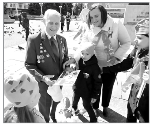
Комсомол Брянщины "Дорогами добра"