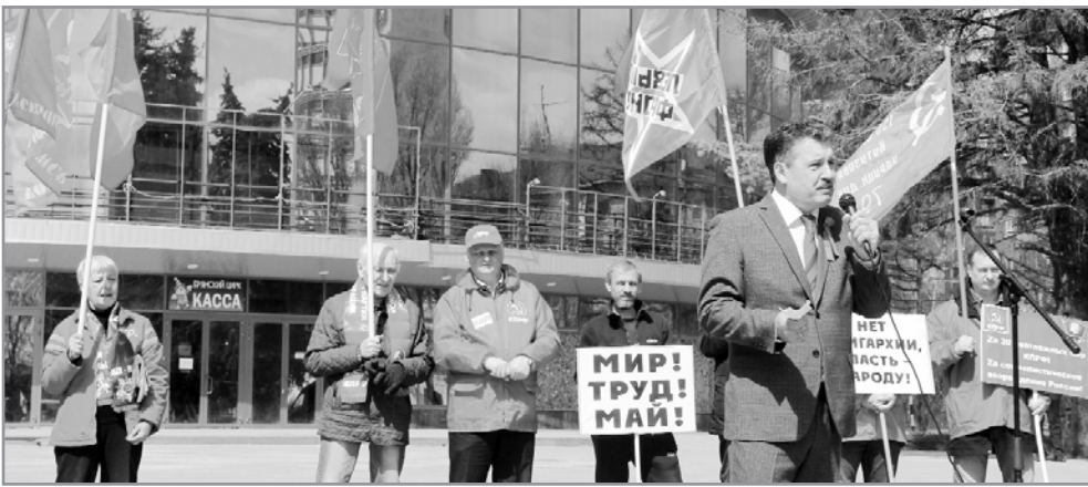
(Окончание. Начало на 1-й стр.).

Красный Первомай – праздник мира, труда и борьбы!