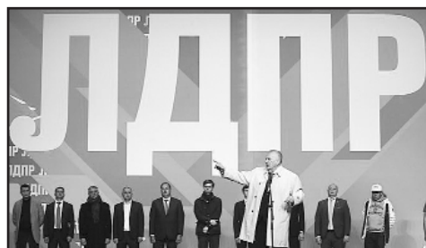
каких-то депутатов или даже фракции давно уничтожено.

Кремль будет не просто влиять – он, собственно, и решит, кому отдать портфель Жириновского. Собственное мнение