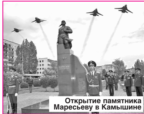
Открытие памятника Маресьеву в Камышине

Прибалтике. Свидетельством его летного мастерства стало повышение по службе – назначение штурманом полка. К этому времени гвардии майор А.П. Маресьев совершил 87 боевых вылетов. Удивительно в этой истории и то, что, вернувшись в боевую часть после ампутации обеих ног, Маресьев сбил еще 7 боевых самолетов, доведя свой список воздушных побед до 11 вражеских машин.