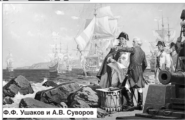
Ф.Ф. Ушаков и А.В. Суворов

Именем Ушакова названы бухта в юго-восточной части Баренцева моря и мыс на север-