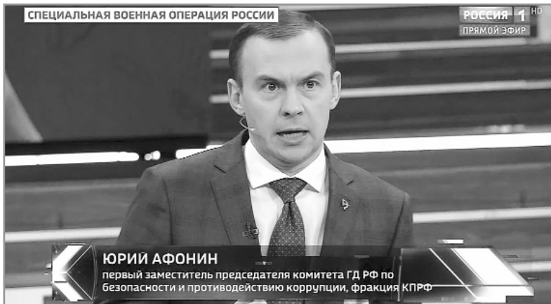
ЮРИЙ АФОНИН первый заместитель председателя комитета ГД РФ по безопасности и противодействию коррупции, фракция КПРФ

Основой экономического развития должны стать планирование и опора на советский опыт