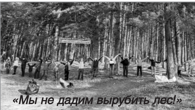
«Мы не дадим вырубить лес!»