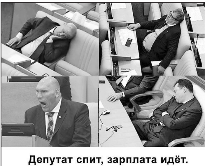
Депутат спит, зарплата идёт.

не всё в порядке. Жалуются они. По словам «народных избранников», в здании на Охотном Ряду работает лишь один небольшой буфет на всех, и меню там оставляет желать лучшего. А из-за плотного графика работы порой за целый день поесть им вообще не удаётся.