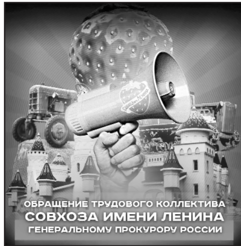
ОБРАЩЕНИЕ ТРУДОВОГО КОЛЛЕКТИВА СОВХОЗА ИМЕНИ ЛЕНИНА ГЕНЕРАЛЬНОМУ ПРОКУРОРУ РОССИИ

что истцы хоть и считают себя акционерами, но хотят получить и долю земли, которая внесена в уставный капитал предприятия. И данный спор они решили разрешить через 25 лет после организации ЗАО «Совхоз имени Ленина», имея на руках как минимум по три вступивших в законную силу судебных акта, установивших отсутствие у них права на долю в землях, а также пропуск срока исковой давности.