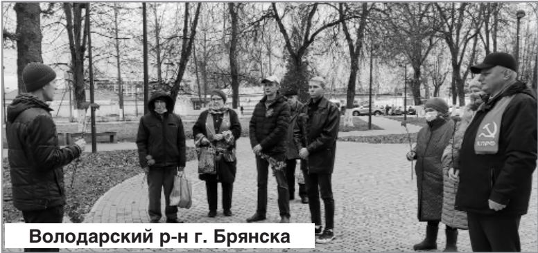
Володарский р-н г. Брянска