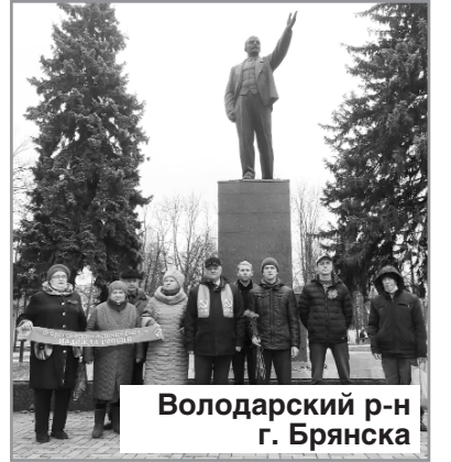
Володарский р-н г. Брянска