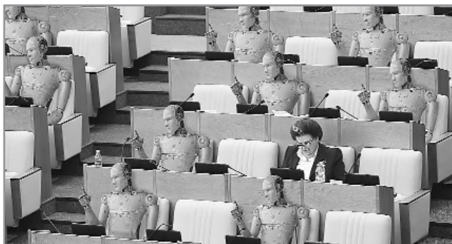
Депутаты Госдумы 8 созыва, выбранные электронным голосованием

чинности они не смеют противиться и исполняют указание беспрекословно. Бывают, правда, и исключения, но нечасто.