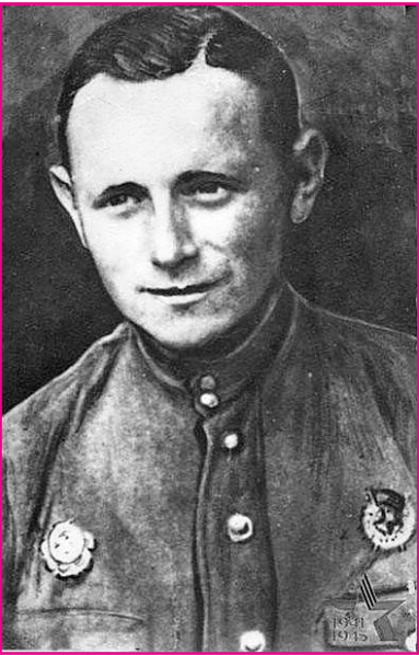
Герой Великой Отечественной войны. Человек-легенда. Яркий коммунист, бежавший на фронт и уничтоживший 150 немцев. За его голову обещали целое состояние. Знакомьтесь: Фриц Ганс Вернер Шменкель – чистокровный немец-антифашист, советский партизан, Герой Советского Союза (посмертно).

105 лет назад, 14 февраля 1916 года, родился Фриц Пауль Шменкель. Его отец был коммунистом и работал на заводе по производству кирпича в г. Варова. Взгляды Шменкеля-старшего шли вразрез с политикой НСДАП, и на одной из антифашистских демонстраций 1923 года его застрелили. Фриц перенял политические взгляды отца и тоже начал выступать против фашистов. В первое время он встречался с друзьями отца и выполнял мелкие поручения, а позже, в 30-х годах, вступил в Союз коммунистической молодёжи Германии, где укрепился в антифашистских взглядах.