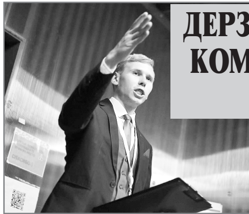
(Продолжение. Начало — на 1-й стр.)

Явка на президентских выборах в Белоруссии составила 84,23%. Как заявила глава Центризбиркома Лидия Ермошина, проголосовали 5 млн. 790 тыс. человек. В Центральной избирательной комиссии заявили, что эти результаты уже вряд ли изменятся, сообщает РИА Новости.