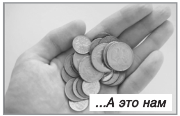
...А это нам

рых российских и зарубежных СМИ рассматривается версия, что покупателями российского золота в Лондоне являются граждане российского происхождения. Те, которые уже обзавелись британскими паспортами (или видом на жительство), или же планируют их приобрести. Алгоритм действий таких «русских» один и тот же: сначала в «страну обетованную» вывозятся дети и другие члены семьи, также деньги. Далее деньги конвертируются в недвижимость и другие активы (ценные бумаги, антиквариат). А уже на завершающей стадии в «страну обетованную» прибывает такой «русский», кото-