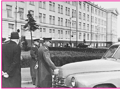
Автомобиль «Победа» – нередкий пример того, что отечественный продукт нравился в прошлом и нравится до сих пор.

Легендарный автомобиль был запущен в серийное производство сразу после Великой Отечественной войны. Таким образом, самим своим названием он напоминает о великом Дне Победы. Этот автомобиль стал символом послевоенной эпохи великих достижений, когда страна возрождалась к жизни из руин, стремясь превратиться в сверхдержаву.