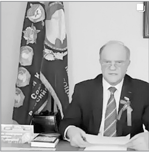
Уважаемые товарищи, друзья, соотечественники!

Поздравляю вас с поистине великим праздником – Днём Победы советского народа над немецко-фашистскими захватчиками!