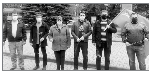
Выгоничские коммунисты возложи-