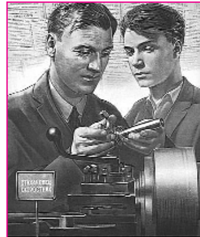
ПРИ СОЦИАЛИЗМЕ НЕТ МЕСТА БЕЗРАБОТИЦЕ!

13 марта – 90 лет назад (1930) закрылась Московская биржа труда; СССР объявил себя первой страной в мире, победившей безработицу;