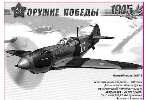
Истребитель МиГ-3 Максимальная скорость – 600 км/ч Дальность полёта – 650 км Практический потолок – 9700 м Вооружение – 20 мм пушка, 7,62 мм и 23 мм пулемёты Экипаж – 1 человек

28 марта – 80 лет назад (1940) состоялся первый полёт советского истребителя И-301 конструкторов С.А. Лавочкина , В. П. Горбунова и М.И. Гудкова .