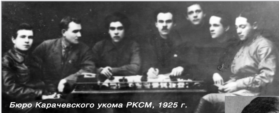
Бюро Карачевского укома РКСМ, 1925 г.

100-летие Ленинского комсомола продолжает своё шествие по Брянщине: свой вековой юбилей отпраздновала Карачевская комсомолка!