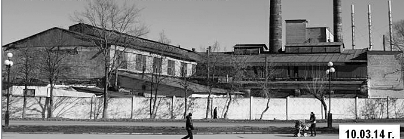
Обе фотографии сделаны с одной точки в городе Дятьково