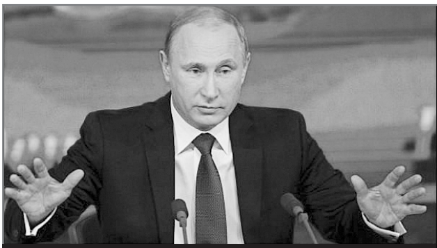
ДАЮ УСТАНОВКУ КРИЗИСА НЕТ. СТРАНА НА ПОДЪЁМЕ.